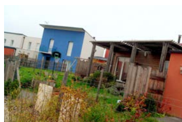
St Léger des bois (49)